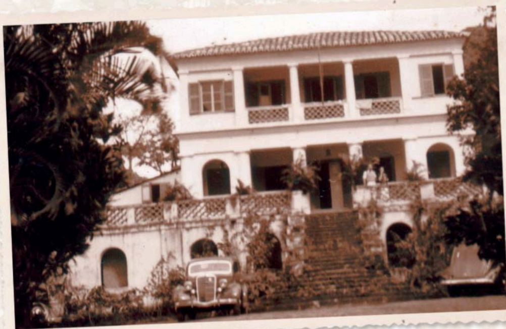
O Solar antes da construção da PUC-Rio, com moradores, s.d.