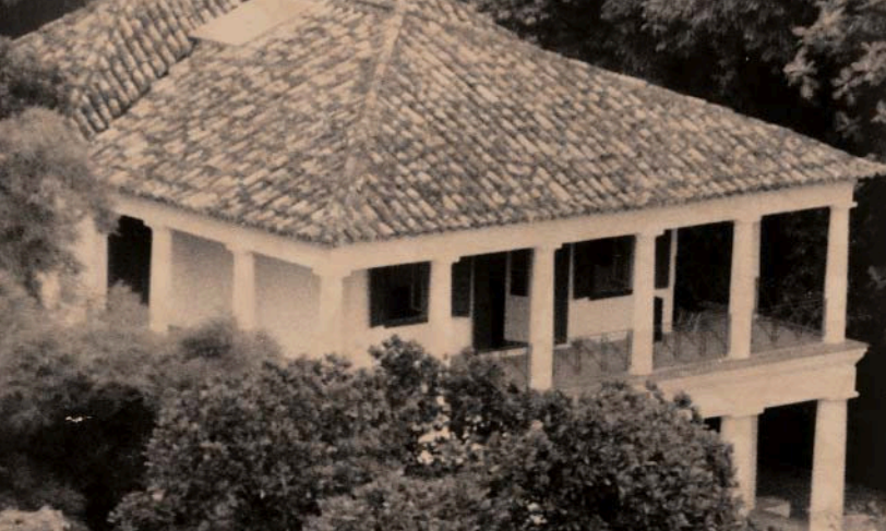
Solar Grandjean de Montigny, s.d.