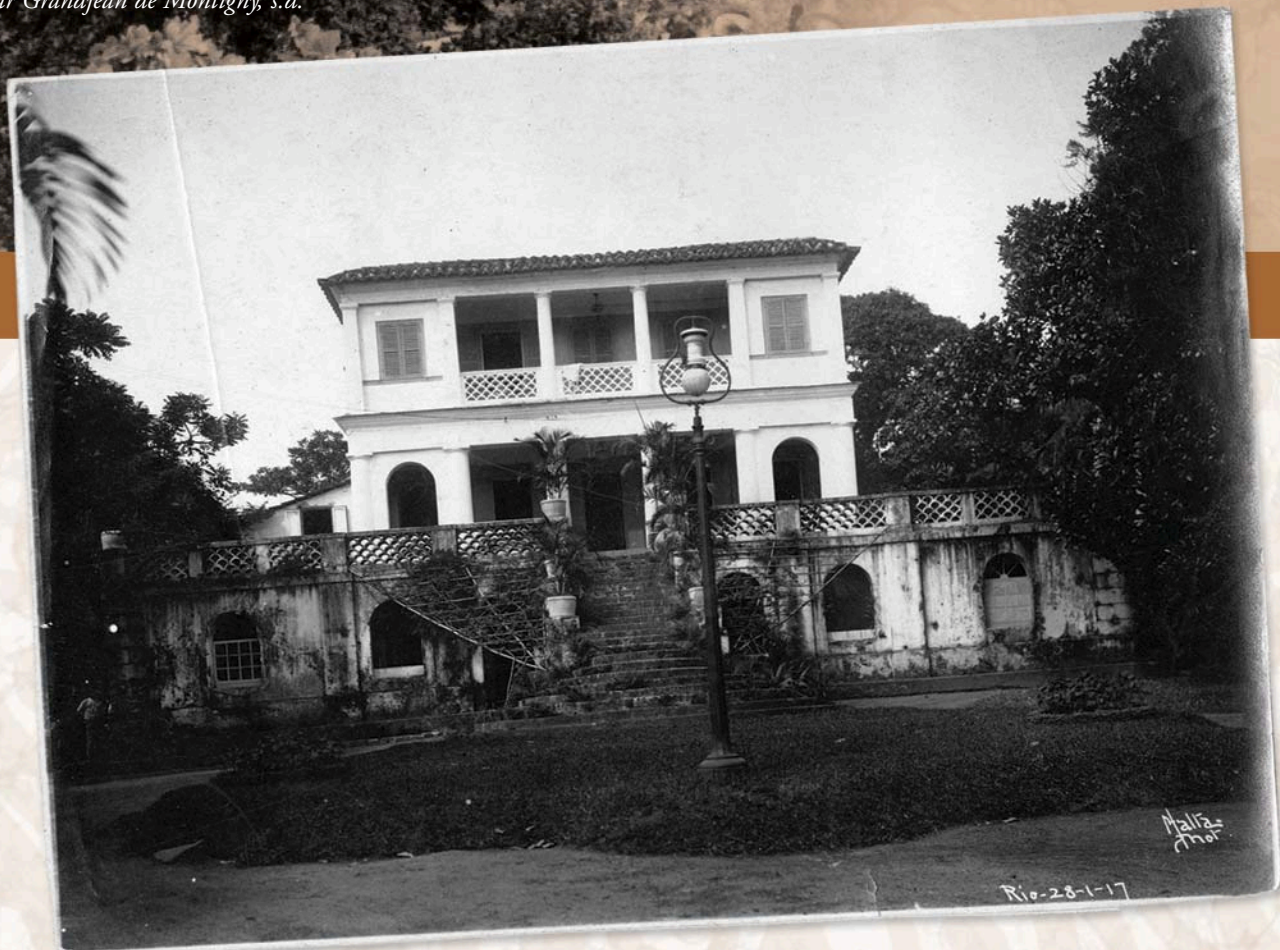
O Solar em fotografia de Augusto Malta, 1917.