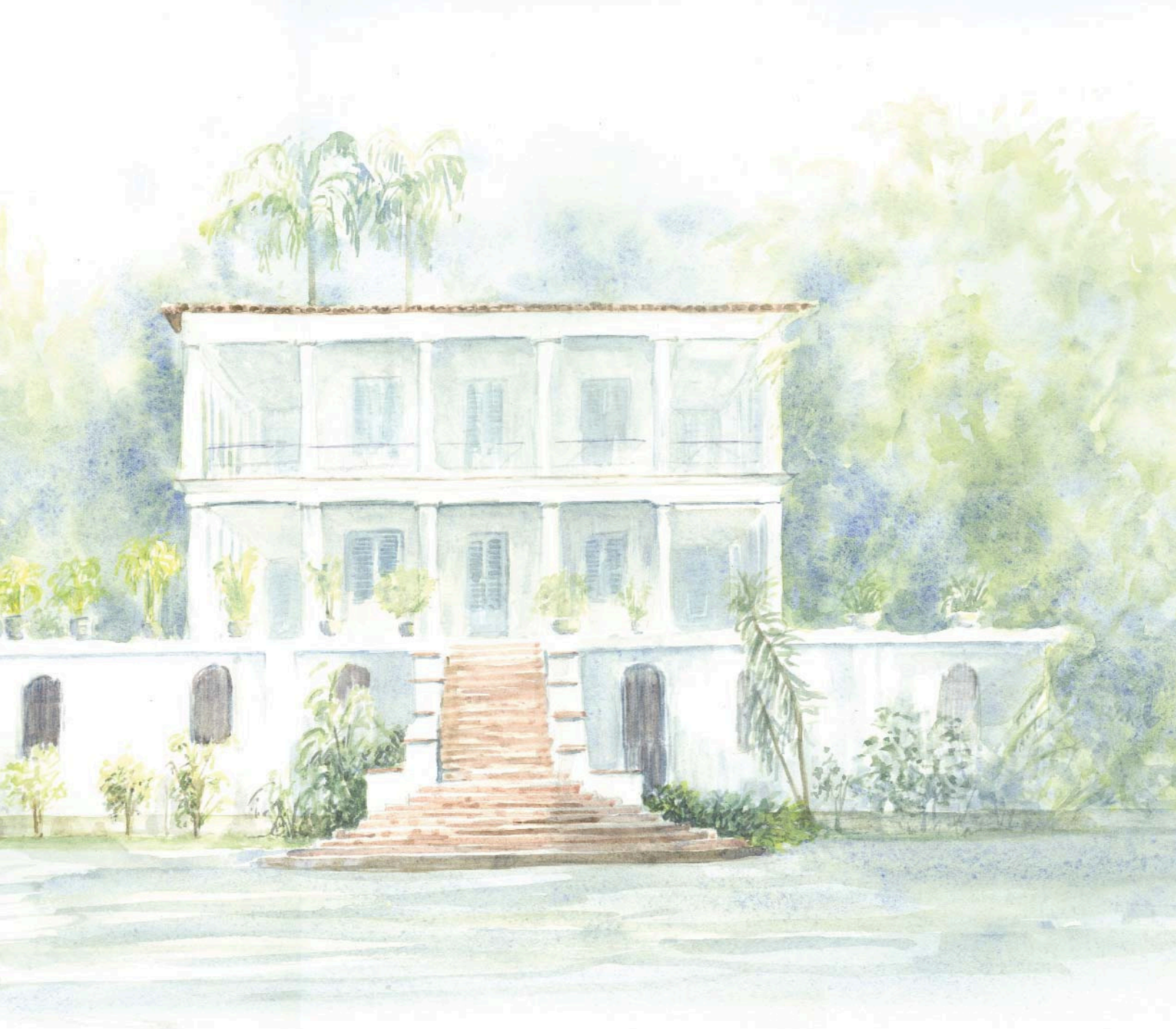
Solar Grandjean de Montigny. Aquarela de Roberto MacMillan, 2004.