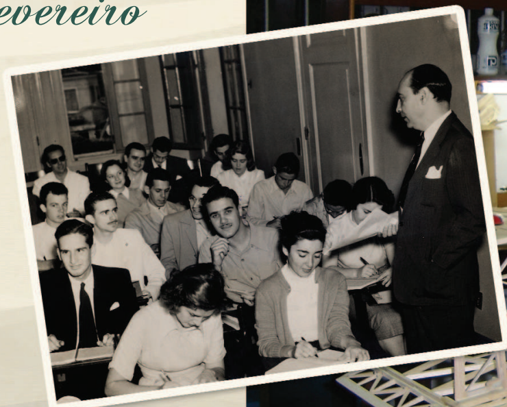
Alunos e professor em sala de aula em uma das casas da atual Vila dos Diretórios. c.1960.