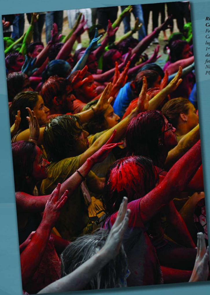
Rito de iniciação. Calouros. 2010. Primeiro lugar do júri popular. 1º Concurso de Fotografia da PUC-Rio, categoria fotos coloridas.

Chegar aos 70 anos e iniciar o caminho rumo aos 80 é atingir um tempo de maturidade.