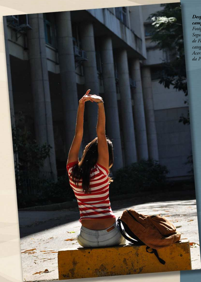
Despertar. Jovem no campus da Gávea. 2010. Segundo lugar no 1º Concurso de Fotografia da PUC-Rio, categoria fotos coloridas.